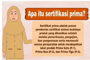
Gambar 7.Tampilan 4