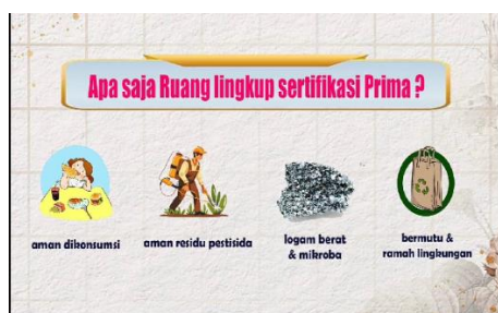
Gambar 11.Tampilan 8

Dalam bagian ini menampilkan pertanyaan apa itu anam di konsumsi, aman residu, pestisida, logam berat dan mikroba, dan beracun dan ramah lingkungan.