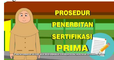
Gambar 5.Tampilan 2

Dalam bagian ini menampilkan karakter akan menjelaskan tentang animasi Penerbitan Sertifikasi Prima.