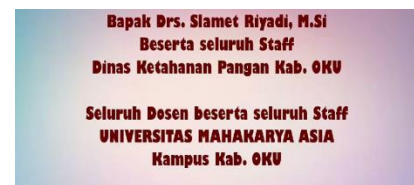
Gambar 21.Tampilan 18

Dalam bagian ini menampilkan tulisan terimakasih kepada kepala dinas ketahanan pangan Kab. OKU dan Seluruh Dosen UNMAHA.