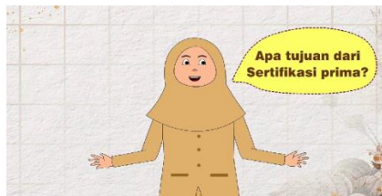
Gambar 8.Tampilan 5

Dalam bagian ini menampilkan karakter sedang menjelaskan tentang apa tujuan dari sertifikasi prima.