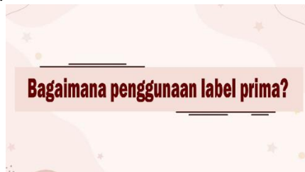
Gambar 17.Tampilan 14

Dalam bagian ini menampilkan penjelasan tentang penggunaan label prima