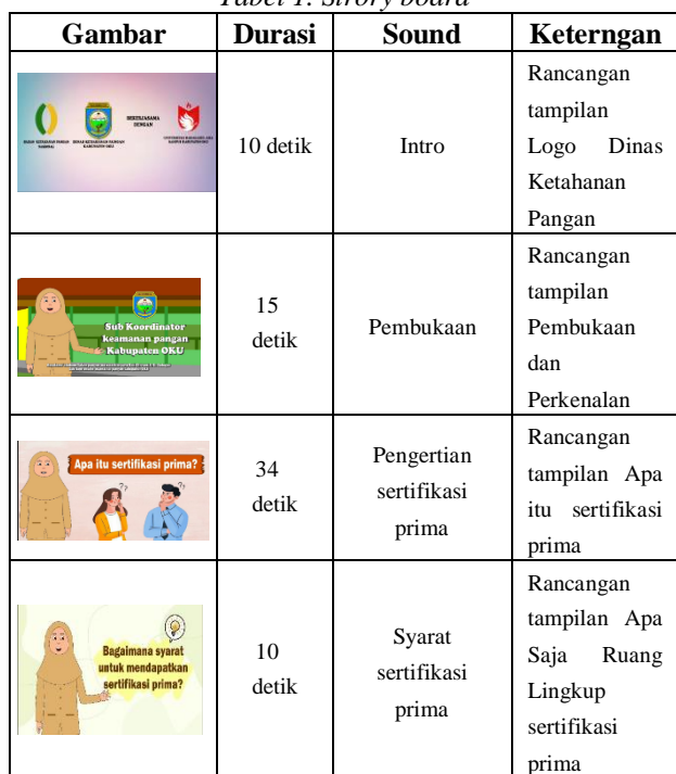
Tabel 1. Story board