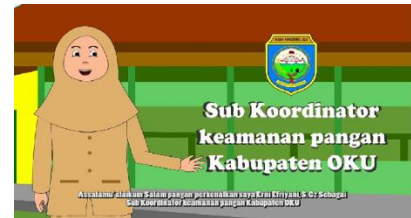
Gambar 4.Tampilan 1

Dalam bagian ini menampilkan karakter memperkenalkan diri.