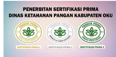
Gambar 4.Tampilan intro 3

Tampilan ini menampilkan tulisan, "Animasi Penerbitan Sertifikasi Prima Dinas Ketahanan Pangan Kabupaten OKU)" berikut tampilannya