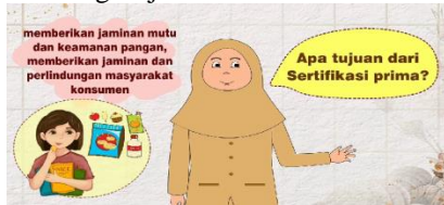
Gambar 9.Tampilan 6

Dalam bagian ini menampilkan karakter sedang menjelaskan tentang Tujuan dari Sertifikasi Prima.