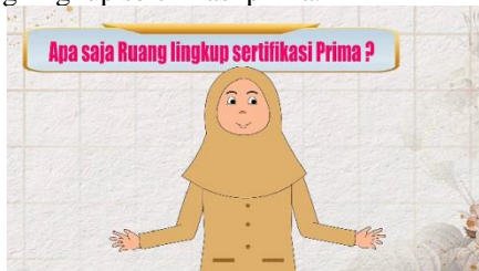
Gambar 10.Tampilan 7

Dalam bagian ini menampilkan karakter sedang menjelaskan tentang lingkup sertifikasi prima.