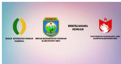
Gambar 2.Tampilan intro 1

Pada saat pertama kali Animasi "Animasi penerbitan sertifikasi prima" ini dijalankan maka yang pertama kali akan ditampilkan adalah video halaman intro berikut ini :