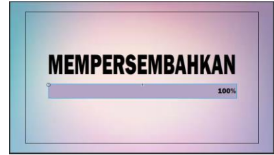
Gambar 3.Tampilan intro 2

Setelah tampilan intro 1 ditampilkan, maka tampilan berikutnya adalah tampilan intro 2 persembahan seperti gambar dibawah ini :