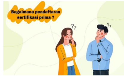
Gambar 12.Tampilan 9

Dalam bagian ini menampilkan karakter bertanya tata cara pendaftaran sertifikasi prima.