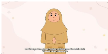
Gambar 19.Tampilan 16

Dalam bagian ini menampilkan karakter memberikan pesan