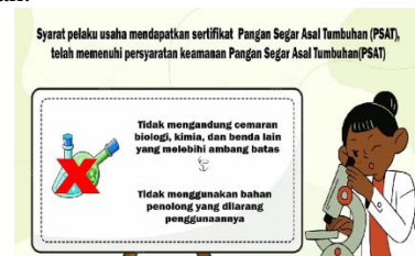
Gambar 14.Tampilan 11

Dalam bagian ini menampilkan penjelasan tentang syarat pelaku usaha mendapatkan sertifikat pangan segar asal tumbuhan.