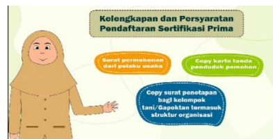
Gambar 13.Tampilan 10

Dalam bagian ini menampilkan penjelasan tentang kelengkapan dan persyaratan pendaftaran sertifikasi prima.