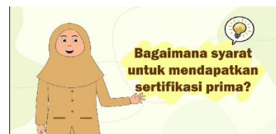
Gambar 15.Tampilan 12

Dalam bagian ini menampilkan penjelasan tentang syarat untuk mendapatkan sertifikasi prima.