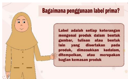
Gambar 18.Tampilan 15

Dalam tampilan ini menampilkan penggunaan label prima