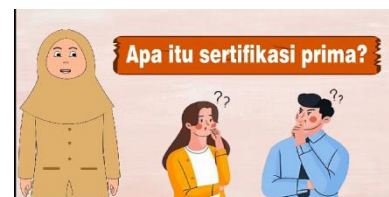
Gambar 6.Tampilan 3

Dalam bagian ini menampilkan karakter sedang bertanya tentang apa itu ketahanan pangan?