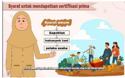
Gambar 16.Tampilan 13